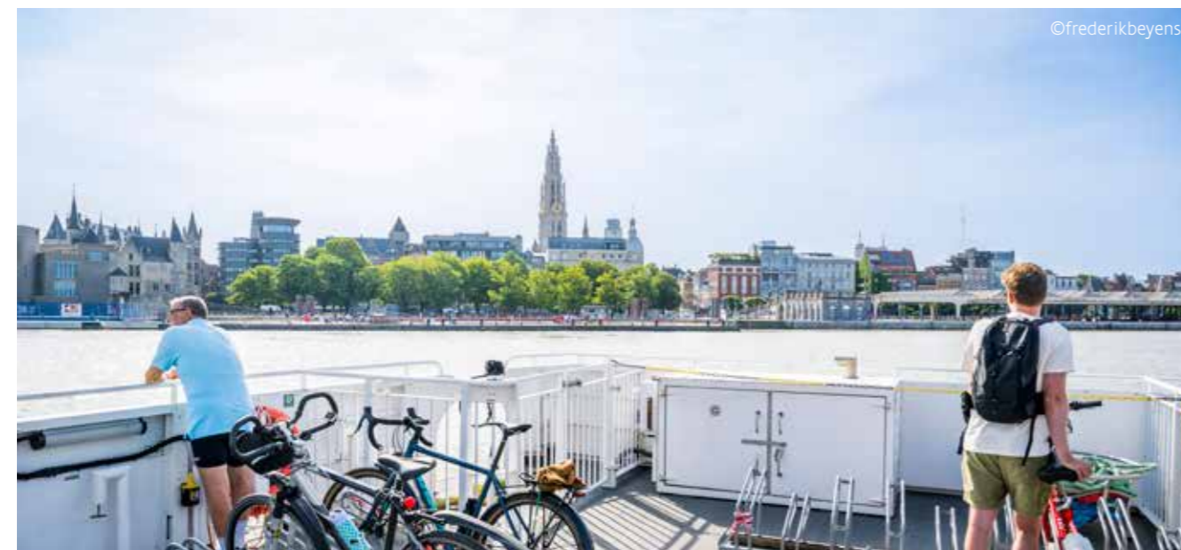
De bussen van lijn 36 op Linkeroever en de bussen uit het Waasland (82, 84, 85, 87, 93, 821 en 931) krijgen een extra halte vlak bij het veer. Het veer is gratis en vaart continu bij grote drukte.